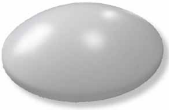
Abb. 4: Dezentres Design mit optimaler Ausleuchtung