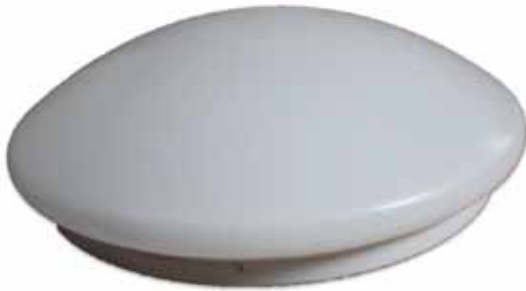
Abb. 2: Klassische runde Form