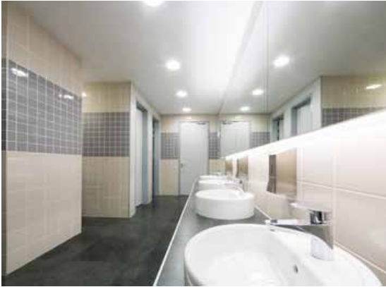
Abb. 1: Optimale Ausleuchtung in Sanitärräumen