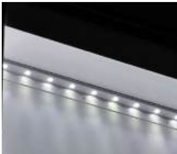
Abb. 3: Setzt die richtigen Lichtakzente