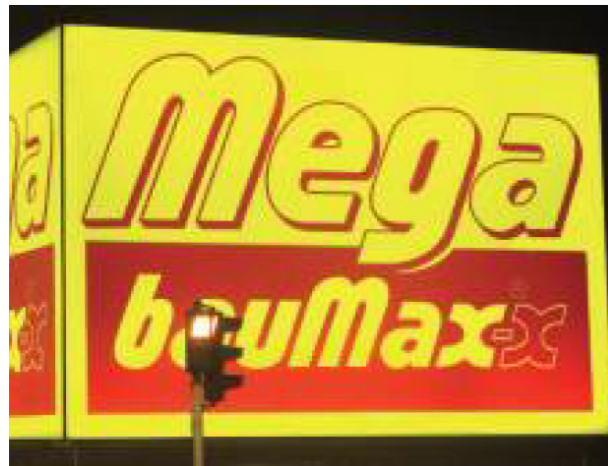
Abb. 1: Ausleuchtung von Lichtwerbung